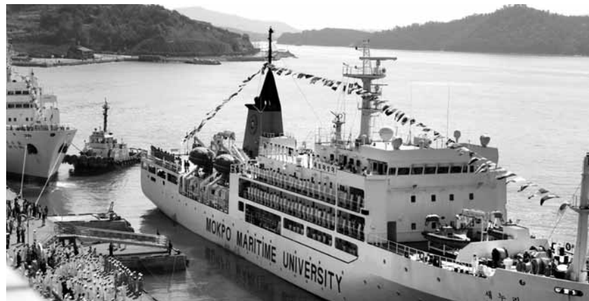
목포해양대학교 해사대학 4학년 학생들이 14일 새누리호에 승선해 국제 항해 승선실습을 떠나고 있다. /목포=김준석기자 kjs0533@

새누리호는 5월 15일까지 32일 동안 목포→말레이시아 코타키나발루→인도네시아 자카르타→베트남 다낭→목포, 새유달호는 5월 13일까지 30일간 목포→필리핀 마닐라→베트남 붕타우→중국 산야항→목포 순으로 각각 항해한다. 학생들은 항해과정에서 선박운용과 관리 능력에 대한 실습뿐만 아니라 목포해양대와 국제 교류협력을 맺은 현지 항만국과 대학 등 유관기관을 방문해 우의를 다진다. 또한 현지 문명과 교민들을 실습선에 초청해 선상 리셉션을 개최하는 등 민간 외교사절단으로서의 역할도 톡톡히 할 계획이다. /목포=김준석기자 kjs0533@