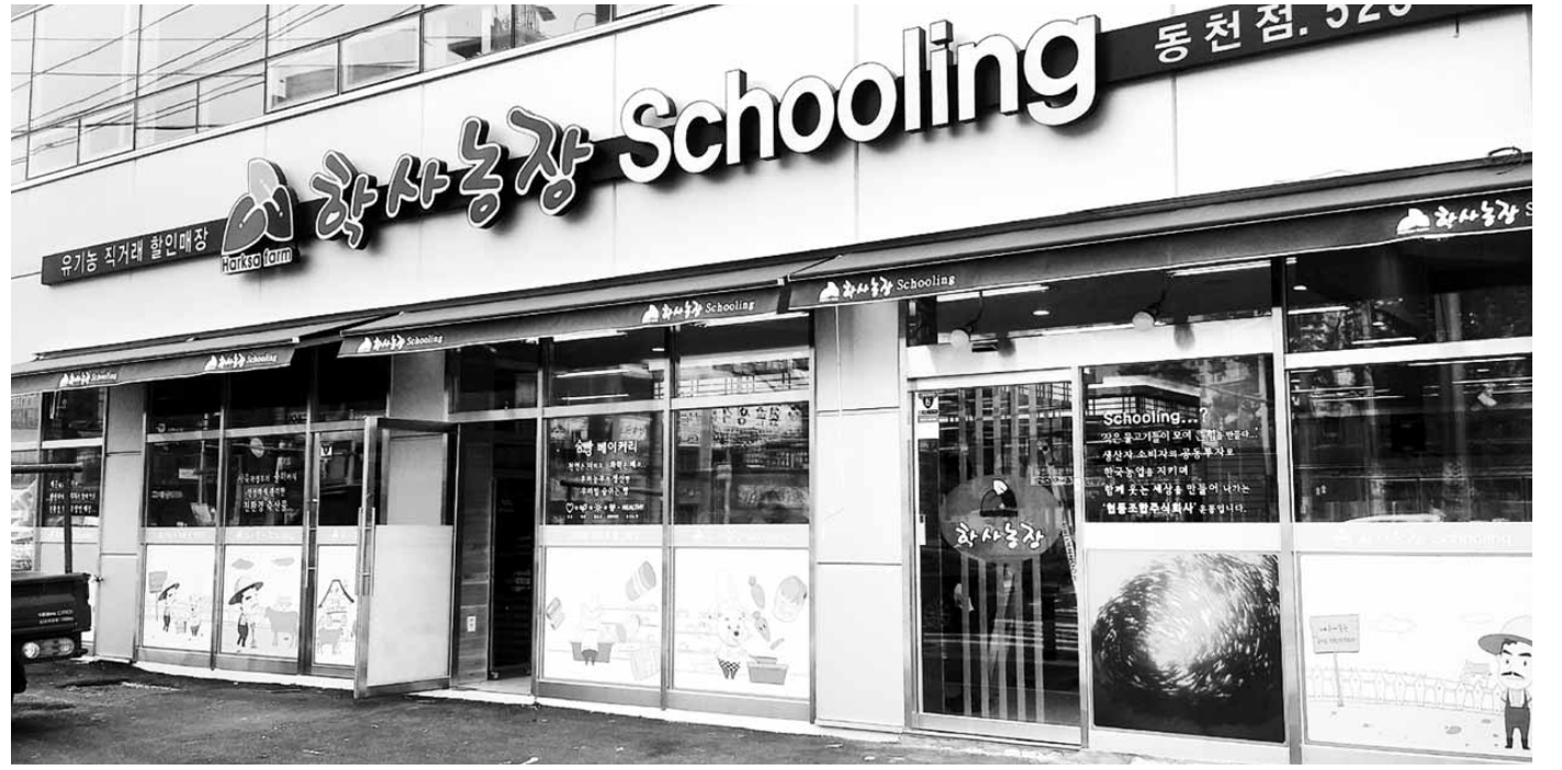
15일 광주시 서구 동천2지구에 개장하는 학사농장 Schooling 1호점 전경.