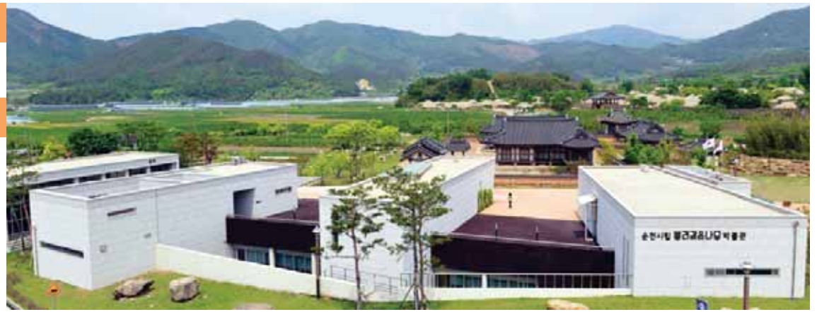
4개의 전시실을 갖춘 전시동과 한옥 수오당, 야외전시장으로 구성된 '순천 뿌리깊은 나무 박물관' 전경.

뿌리깊은 나무 박물관은 사람들에게 많이 알려져 있지 않지만 알찬 전시자료들이 가득하다. 2개의 상설전시실에서는 토기, 불교 용구, 민속 공예품 등 청동기 시대부터 광복 이후까지 유물을 만날 수 있다. 향아리 모