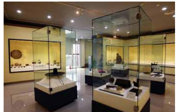
박물관에는 청동기 시대부터 광복 이후까지의 유물 6500여점이 전시돼 있다.