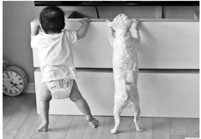
양준열 작 ‘공통관심사’

이해해 보고, ‘알송달송 박물관이야기’(초등학교 5~6학년)는 박물관의 다양한 실물자료(유물)를 직접 관찰하고 기록하며 박물관에서 일하는 보존과학자의 역할을 체험하는 프로그램이다. 중·고등학생을 대상으로는 ‘박물관에서 찾은 나의 꿈’, ‘금동관의 주인은 누구?’, ‘금보다 귀했던 마한의 옥’ 등 프로그램이 진행된다. 모든 프로그램은 화~금요일 오전 10~12시 진행된다. 문의 061-330-7822. /김경민기자 kki@kwangju.co.kr