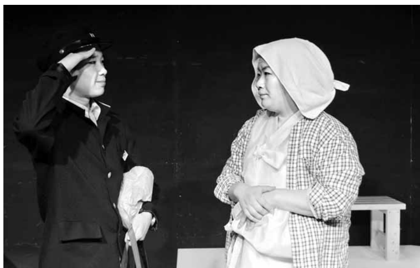
극단 새결 ‘돌아오지 않는 오월, 세월의 늪을 건너...’

4월16일, 생각만으로도 가슴이 저미는 날이다. 광주·전남 지역 문화예술단체들이 세월호 참사 1주기를 맞아 희생자와 유가족을 위로하기 위한 다양한 문화 공연을 진행한다.