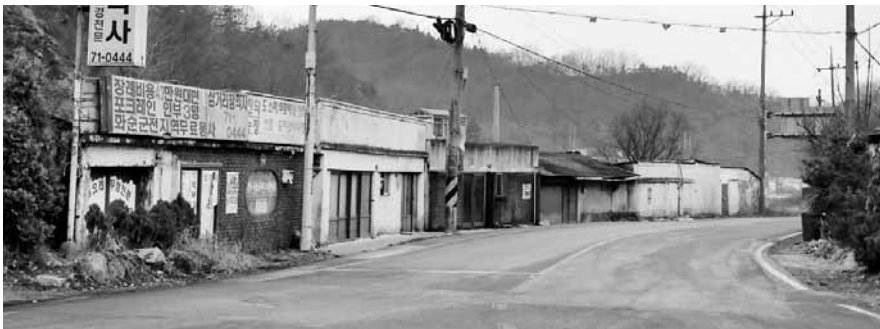
'제로 에너지마을 공모사업' 대상으로 선정된 화순군 동면 북암리.

앞서 동면 북암리 2·3구 구암지구는 '2015년 취약지역 생활여건 개조사업' 공모사업에도 확정돼 오는 2017년까지 3년간 총 41억원(국비 31억, 지방비 10억)의 사업비를 확보 ▲주택 정비사업(슬레이트 지붕철거, 빈집 정비, 집수리 등) ▲기반시설 정비사업(소방도로, 소화전 정비, 교량 신설 등) ▲마을경관 정비사업(소공원 조