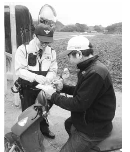
고 발생사례를 함께 설명해줌으로써 자발적인 동참 분위기를 조성해 노인 등의 교통 사망사고를 예방하겠다"고 밝혔다. /장성=김용호기자 yongho@