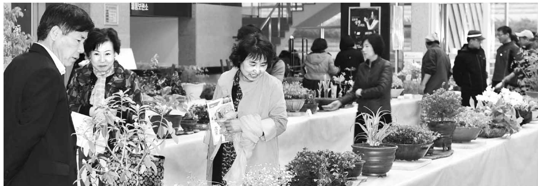
장성 희귀 야생화 구경 오세요 장성 군민들이 최근 장성을 문예회관을 찾아 야생화를 감상하고 있다. 백양 야생화연구회 회원 60명은 영초와 금낭화 등 300여점의 희귀 야생화 작품을 선보였다.