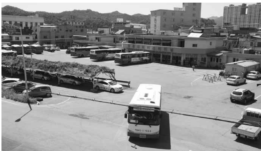
이용객 감소로 경영난을 겪고 있는 장흥읍 건산리 공용터미널.

대로 들어와있는 장흥 시내 버스회사가 올 연말께 별도 부지를 마련, 이전하면 군이 방대한 면적이 필요없다는 것.