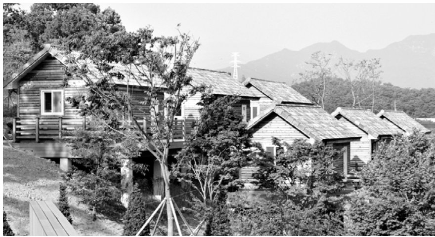
순창군 풍산면 대가리 향가마을 섬진강변에 조성된 오토캠핑장 내 방갈로.