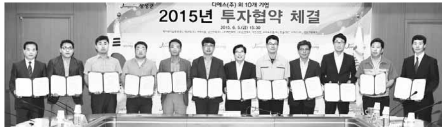
2015년 투자협약 체결 장성군과 IT(정보기술)·환경기술 분야 관련 11개 업체가 최근 군청 상황실에서 투자협약을 갖고 있다. 군은 민선 6기 들어 47개 기업을 유치하는 성과를 거뒀다.

총 303억원 규모 투자협약 민선 6기 들어 47개 유치 992억 투자 820명 고용창출