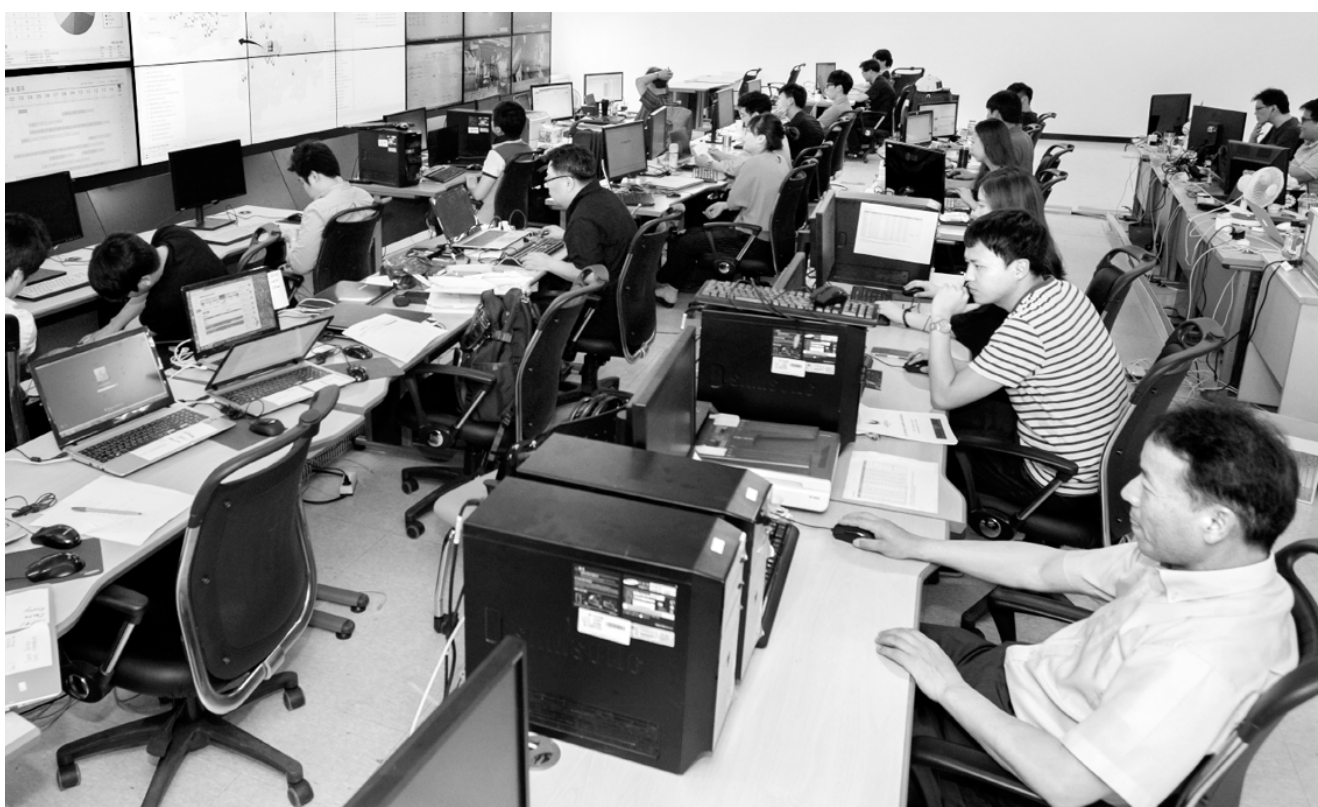
14일 광주시 동구 호남동 광주U대회 조직위 10층에 마련된 'IT종합상황실'에서 직원들이 각종 상황에 대비한 실천 대응 훈련을 하고 있다.

IT종합상황실 단장을 중심으로 조직위 정보통신부 인력과 SK C&C, SK텔