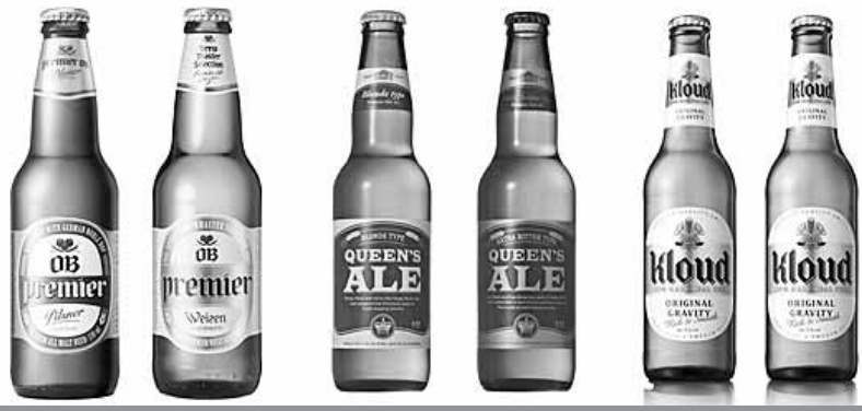
다양한 소비자들의 욕구에 부합하기 위해 국내 맥주업체가 프리미엄 맥주 제품을 강화하고 마케팅에 주력하고 있다. 오비맥주의 프리미엄 오비 필스너·바이젠, 하이트진로의 퀸즈에일, 롯데클라우드 맥주.

국산 맥주 업체들의 고민이 깊어지고 있다. 수입 맥주에 밀려 시장이 축소되는데다 과점 소주, 저도 위스키 등 새로운 주류에 대한 관심이 커지며 설 자리가 좁아지고 있기 때문이다. 업계는 '살 길'을 찾기 위해 '고급화' 전략에 사활을 걸고 있다.