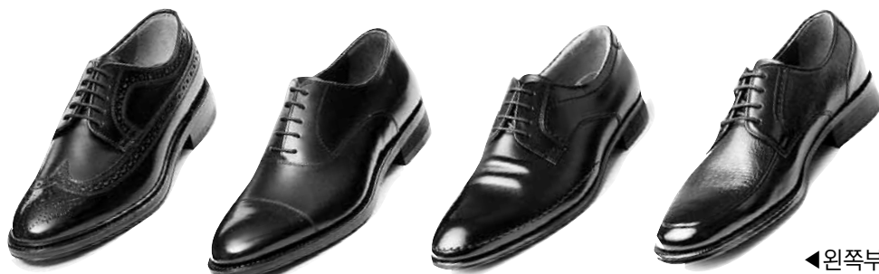
◀왼쪽부터 광주, 서울, 부산, 대전 지역민 구두 선호 디자인.

금강제화 관계자는 "지역별 고객 니즈를 반영해 소비자들이 선호하는 다양한 구두를 개발하고 지역별 맞춤 마케팅을 펼쳐갈 계획"이라고 했다. /김대성기자 bigkim@