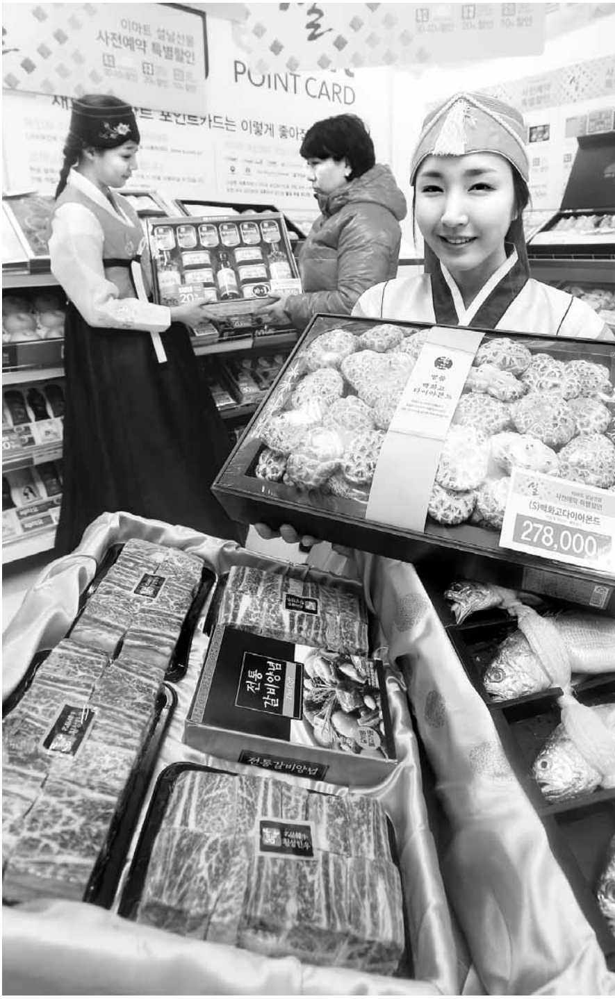
추석 명절 농산물과 한우세트는 잘나가는 선물이다. 지난해 추석을 맞아 한 대형마트에서 점원이 버섯과 한우선물세트 등 판촉행사를 펼치고 있다.