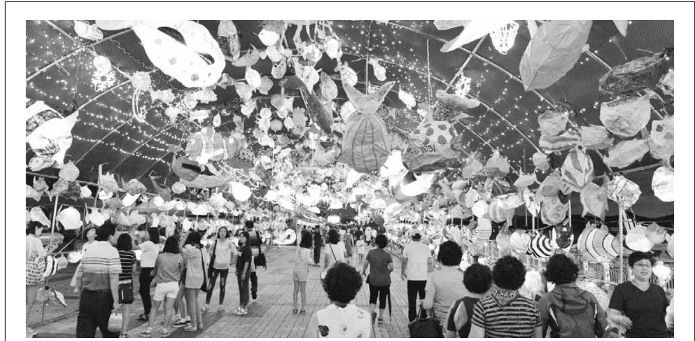
‘목포 항구축제’ 대표 볼거리 중 하나인 ‘어등(魚燈)터널’.

중창, 합창으로 부르는 대회를 열어 왔다. 올해 대회에서 학생들이 즐겨 부른 노래는 ‘태청가’와 ‘금가락지’, ‘추풍부’, ‘영광의 빛’, ‘야국’, ‘석류’, ‘내고향’, ‘앞날의 꿈’ 등이었다. 김관수 교육장은 “학생들의 바른 인성과 따뜻한 감성을 기를 수 있는 다양한 문화예술 프로그램을 마련해 인재를 많이 길러내겠다”고 강조했다. /영광=이종윤기자 jylee@