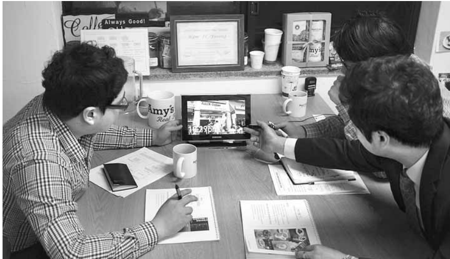
창업 전 가맹 본부의 사업 개시 연도, 총 가맹점 수, 전지점 매출액 평균, 가맹 부담금 등 정보가 담겨 있는 정보공개서를 꼼꼼히 살피는 것은 필수적이다. 창업 상담을 하고 있는 예비창업자.

브랜드 역사·가맹점 생존력 살펴야 낭패 안봐 단순 매출액, 점포수 비교는 금물... 전략적 접근 법 위반 사실, 부채율, 본사 교육 현황 체크도