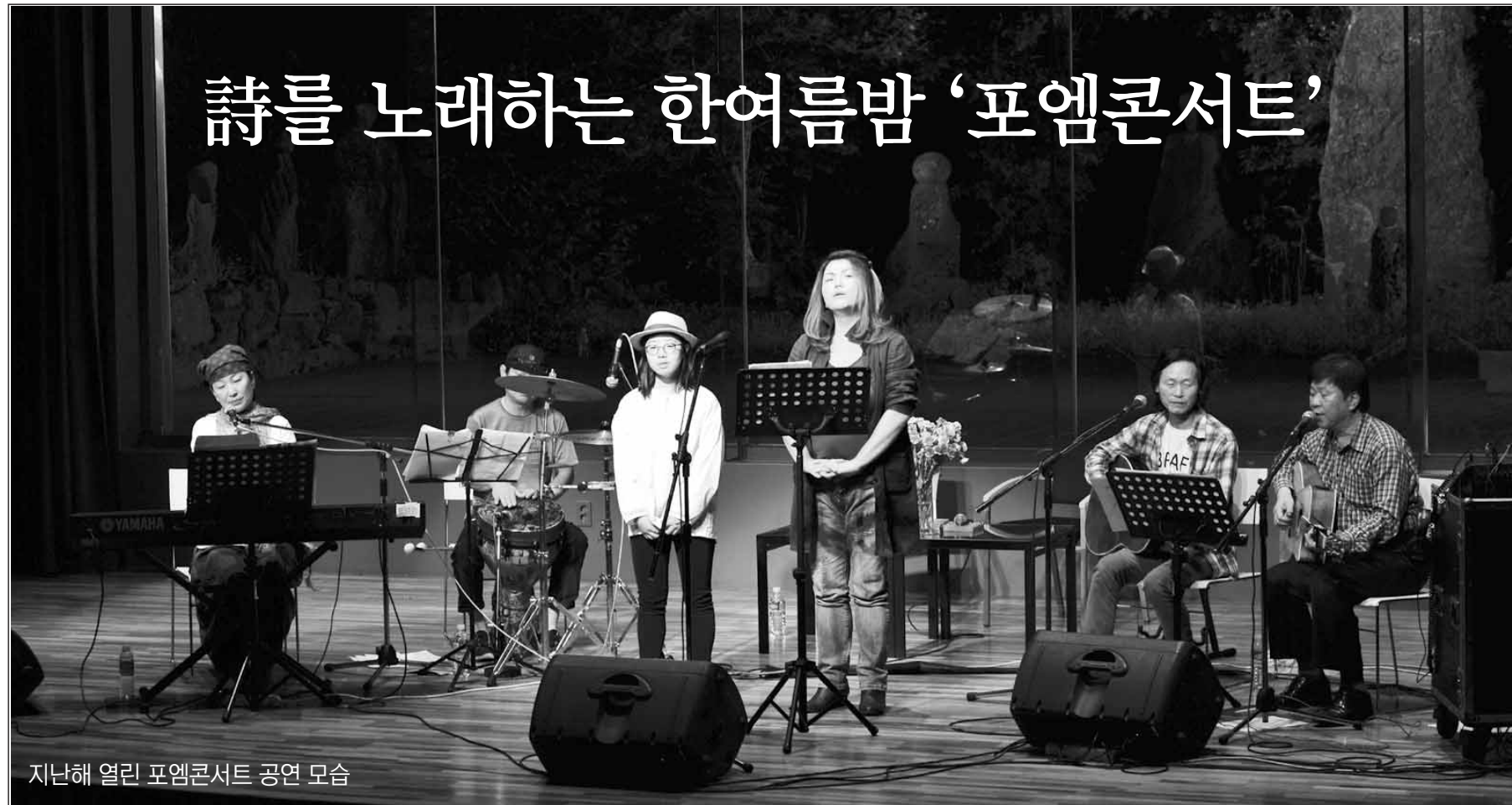
지난해 열린 포엠콘서트 공연 모습