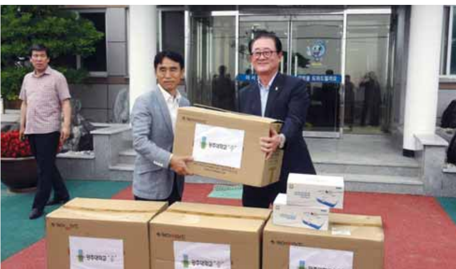
김혁중 광주대 총장이 영광군 송이도를 방문, 경로당에 상비약품을 전달하고 있다.

광주대학교 (총장 김혁중·오른쪽) 교사와 간호학과 학생 20여명은 지난 21일 영광군 낙월면 관내 송이도, 상낙월도, 하낙월도 3개 도서지역을 순회 방문하며 주민건강 관리와 법률상담 등 무료봉사활동을 실시했다.