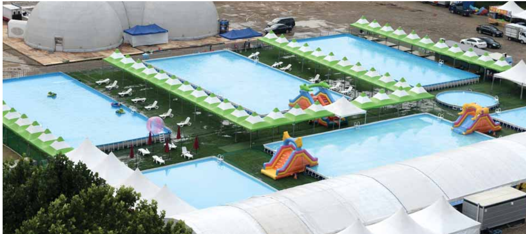
광주시 서구 상무조각공원 인근에 마련된 '2015 광주 판타지4 뮤직페스티벌'(24일~8월9일) 행사장은 대형 에어돔 공연장, 야외 수영장, 먹거리 존 등으로 구성됐다.