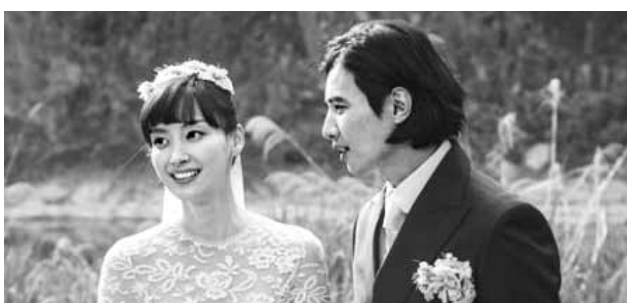
오경하 이드나인 이사는 "현재 이나영이 임신 몇 주자인지는 소속사에서 알지 못한다"고 말했다.

지난 5월 말 강원도 정선에서 비밀리에 소박한 결혼식을 올린 톱스타 배우 원빈·이나영 부부(사진)가 부모가 된다. 원빈과 이나영의 소속사 이드나인은 3일 "서로 배려하며 여느 부부와 다를 것 없이 신혼 생활을 보내고 있던 이나영과 원빈에게 새로운 가족이 생겼다"고 밝혔다. 소속사는 "사랑하는 연인을 넘어 믿음을 나누는 하나가 된 두 사람은 작품 활동은 물론이고 인생의 소중한 계획들을 차근차근 함께 해나가던 중 새로운 가족의 소식을 전해 드리게 돼 감사하게 생각하고 있다"고 덧붙였다. 서울 서초구 방배동에 신집살림을 차린 두 배우는 결혼 생활 두 달이 갓 지나 임신 소식을 전하게 됐다. /연합뉴스