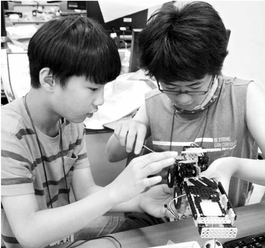
호남대 IT영재교육원 여름캠프에 참여한 학생들이 로봇을 만들고 있다.

GIST 문승현 총장은 “이번에 선정된 연구 과제들은 기술사업화, 기초 원천 기술 확보, 지역 산업과 기업 육성이라는 GIST의 설립 목적과 비전에 부합하는 국가 핵심 사업들”이라고 말했다. /채희종기자 chae@