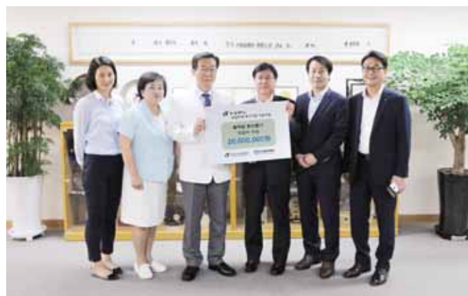
한국농수산식품유통공사(aT·사장 김재수)가 최근 투병중인 혈액암 환자들을 돕기 위해 화순전남대병원(병원장 조용범)에 2000만 원을 기부했다.