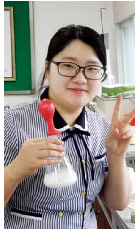
은하빛 양파발을 보고 양파에 대한 정보를 검색하게 됐다. 그렇게 1년 뒤 그녀는 양파 효능을 살려 천연재료로 만든 '붙이는 치통치

료제'로 교내에서 1등을 차지했다. 양파가 바이러스를 흡수한다는 것에 착안, 껌 형태로 만들었는데, 이것도 치통이 심한 자신의 경험 이 바탕이 됐다.