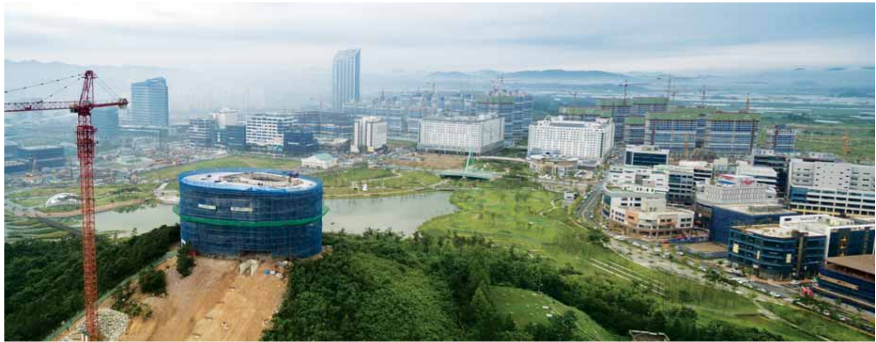
가슴 뻥~나주 배메산 전망대

24일 오후 나주 빛가람혁신도시 내 배메산 정상에 전망대 신축공사가 진행 중이다. 배메산 전망대는 전남개발공사가 190여억원에 투자해 지상 2층(높이 23.5m) 규모로 신축 중이며 오는 10월 완공을 목표로 하고 있다.