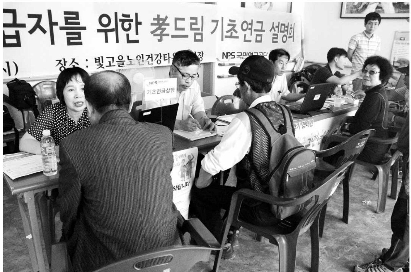
올해 기초연금을 받는 65세 이상 어르신은 전체(661만8000명)의 67%인 441만 명인 것으로 나타났다. 사진은 기사 내용 중 특정 사실과 관련 없음.