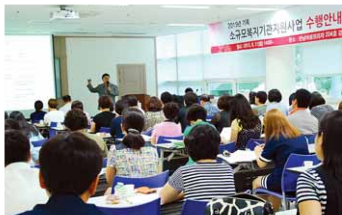
전남 사회복지공동모금회(회장 허 정)는 최근 전남여성플라자에서 사회복지시설 관계자 70여명을 대상으로 사업수행안내 교육을 실시했다.