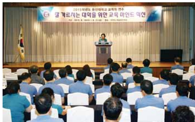
동신대학교(총장 김필식)는 최근 3일 동안 안면도 리솜오션캐슬에서 '잘 가르치는 대학을 위한 교육 마인드 혁신'을 주제로 보직자 연찬회 및 전체 교직원 연수를 개최했다.