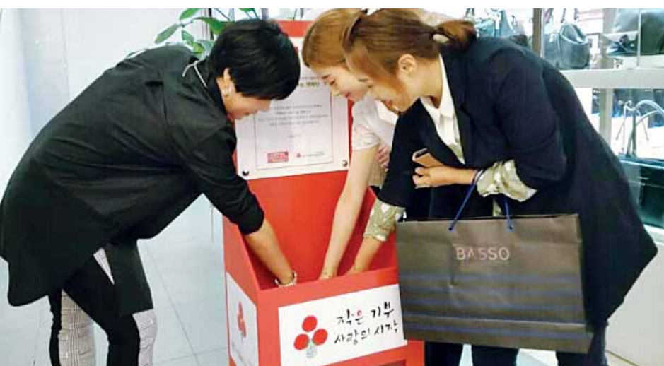
26일 광주시 광산구 수완지구 롯데아울렛 수완점을 찾은 고객들이 매장에 설치된 '사랑의 모금함'에 성금을 넣고 있다.