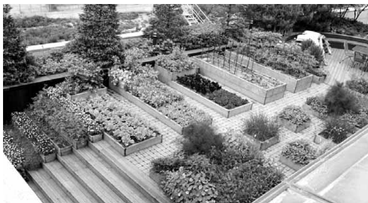
실외에서의 텃밭 설치 사례