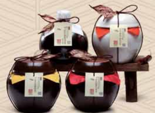
기순도 전통 정모음(동) 세트 이미지사진

광주·전남이 배출한 '대한민국 식품명인' 9인의 전통과 품격이 담긴 프리미엄 기프트를 제안합니다. 광주신세계에서 남도의 숨결이 깃든 손맛을 경험해보세요.