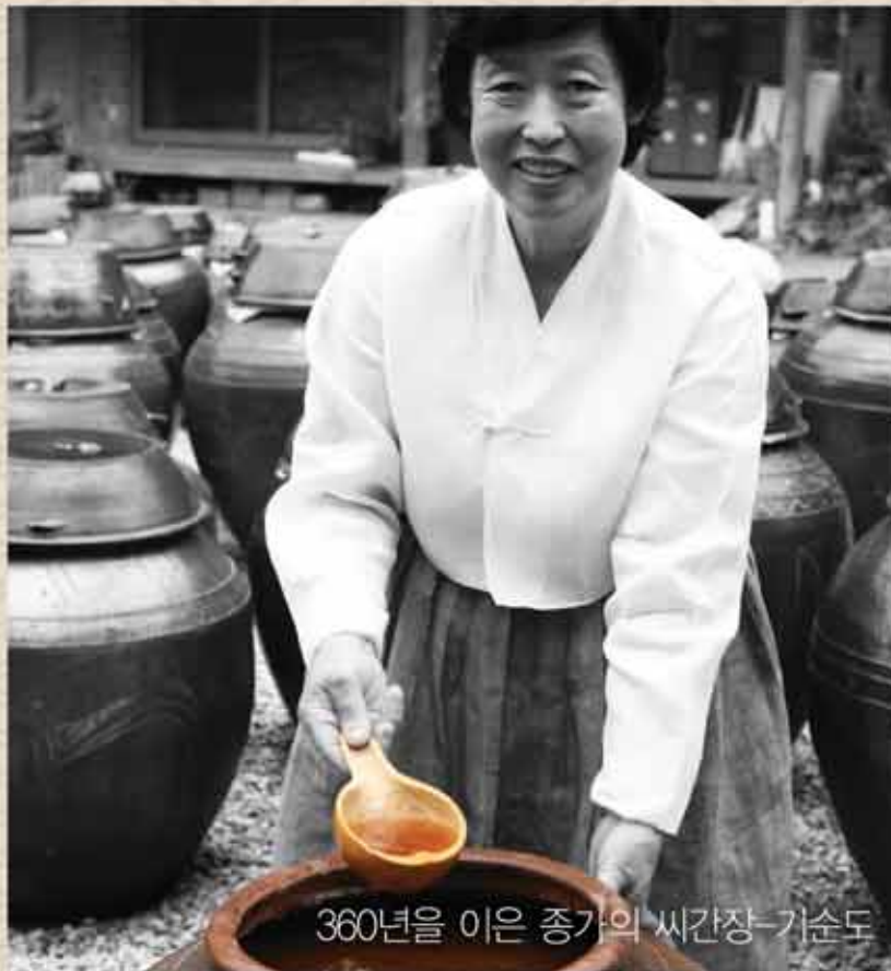
360년을 이은 종가의 씨간장-기순도