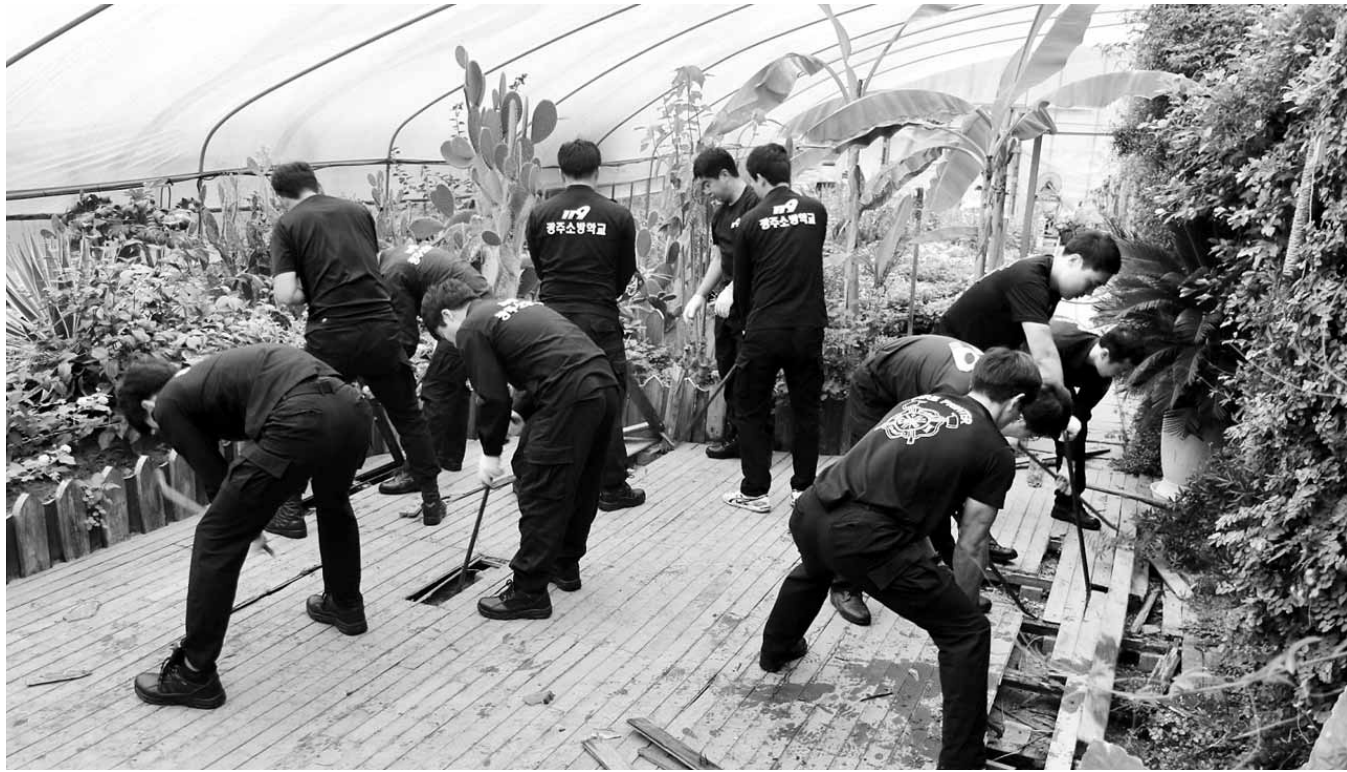
신임 소방관들의 봉사활동 광주소방학교에서 교육받고 있는 신임 소방관 77명이 1일 광산구 삼거동에 위치한 장애인 복지시설 '소화성 가정'을 찾아 각종 시설물을 고치고, 청소하는 등 봉사활동을 펼쳤다.