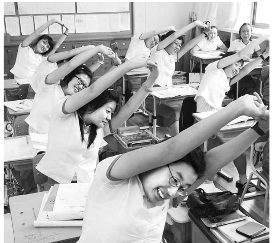
광주·전남 청소년들은 놀 시간도, 잘 시간도 충분하지 않다. 사진은 광주지역 한 여고에서 쉬는 시간 맨손 체조를 하는 여고생들의 모습.