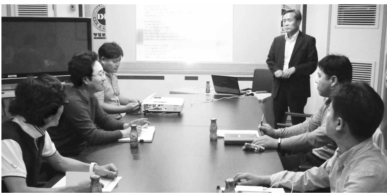
동강대 BI센터는 최근 입주 업체 관계자들을 대상으로 ‘자금 조달’, ‘제품 디자인’ 분야 뿐 아니라 ‘홍보·마케팅’과 ‘보도자료 작성’ 부문에 대해서도 멘토링 사업을 진행, 호응을 얻고 있다.

상당수 기업들이 제품 개발에만 몰두, 상품 특징 등을 효과적으로 알리는 홍보 방안이나 마케팅 기법 등 개선 방안을 찾아 기업들에게 제공하고 있는 것으로, 중소기업청의 ‘2015년 창업보육센터(BI) 운영평가’를 통해 13년 연속 최우수(S) 등급을 받는 창업보육의 선두주자다운 지원 활