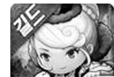
와이디온라인 '드래곤을 만나다'