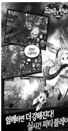
함께해! 더 강해진다! 실시간 파티플레이

와이디온라인(대표 신상철)의 '드래곤을 만나다'는 캐주얼하게 디자인된 캐릭터를 육성해 나가는 액션 롤플레이어 스마트 모바일 게임이다.