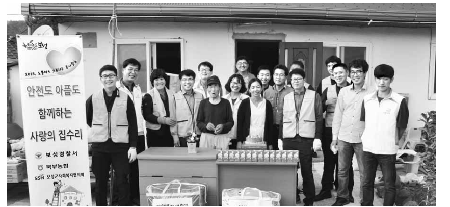
보성경찰서 청렴동아리 회원과 봉사단체인 좋은이웃들 등 자원봉사자들이 지난 15일 다문화가족 폭력 피해자 집을 방문해 도배와 청소 등 봉사활동을 펼친 뒤 위문품을 전달하고 있다.

축제기간을 전후로 제철을 맞은 꼬막의 쫄깃쫄깃한 육질과 맛은 일품으로 꼽힌다. 선승규 별교꼬막축제추진위원장은 “축제를 통해 보성군민의 화합을 이루고 지역의 문화와 특산물인 꼬막을 널리 홍보해 대한민국 문학기행 1번지인 별교가 우리나라를 대표하는 체험 축제장이 될 수 있도록 준비해 최선을 다하겠다”고 말했다. /별교=김윤성기자 kim0686@