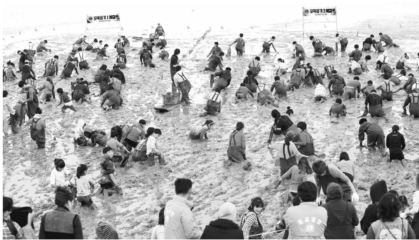
별교 진석리 갯벌 체험장에서 지난해 열린 '별교 꼬막축제'에 참가한 관광객들이 꼬막잡기와 널배타기 등 다양한 체험 행사를 즐기며 즐기고 있다.

둘째 날인 31일에는 지역동아리공연과 꼬막단지기, 꼬막무게 맞추기, 꼬막끼기 경연, 중도방죽길 꽃차 타기, 해설과 함께하는 태백산맥 문학기행, 바퀴 달린 널배타기 대회 등 체험행사 등이 열릴 예정이다. 특히 이날 오후 5시에는 평양예술단