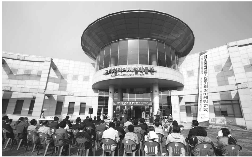
강진군 고려청자디지털박물관에서 지난 20일 청자소공인특화지원센터 개소식이 열렸다.

특화지원센터는 특히 강진청자 용·복합 상품디자인 공모전을 개최하고 연계상품 개발을 통해 청자 업체의 판로 개척 및 전통 문화상품의 다양성을 확보해나간다는 계획이다.