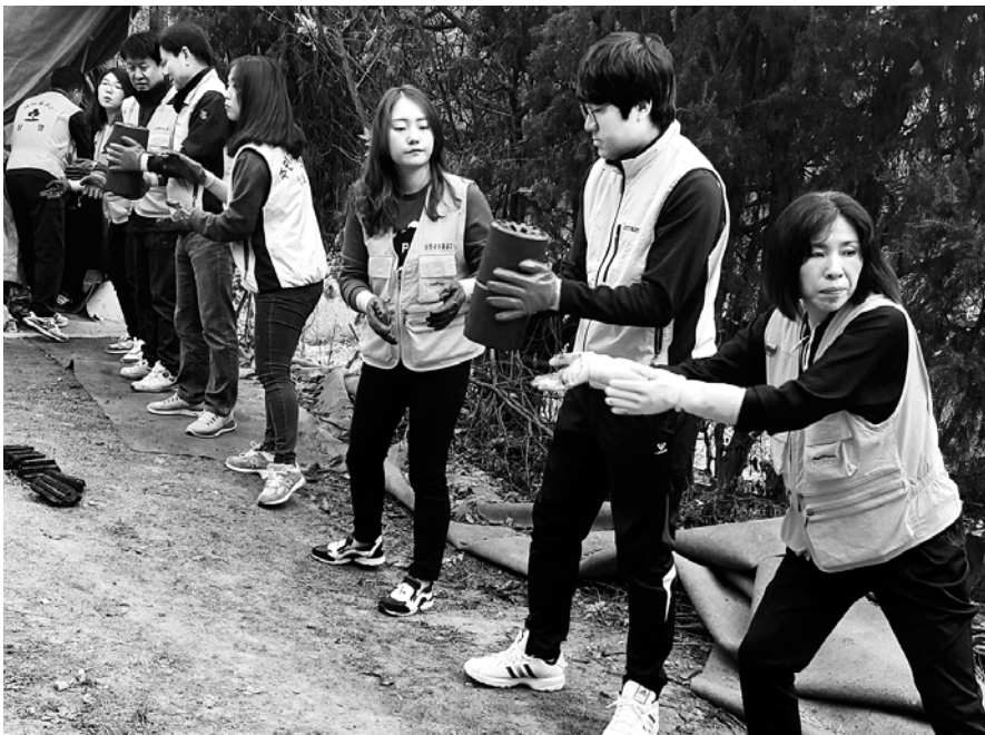
사랑의 연탄 배달