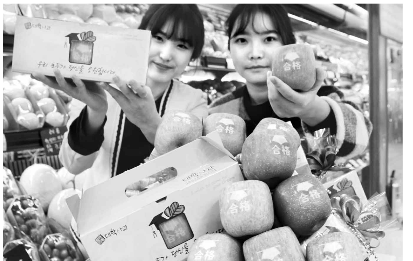
수능 합격 사과 인기 2016학년도 대학수학능력시험(12일)을 앞둔 최근 롯데백화점 광주점 지하 1층 식품관 천과코너에서는 '합격(合格)'이라는 글자가 새겨진 수능 합격기원 대학사과를 선보였다. 수험생들에게 수능 선물로 인기가 많은 합격 사과는 3개 묶음에 2만2000원, 1개당 8000원에 판매하고 있다.