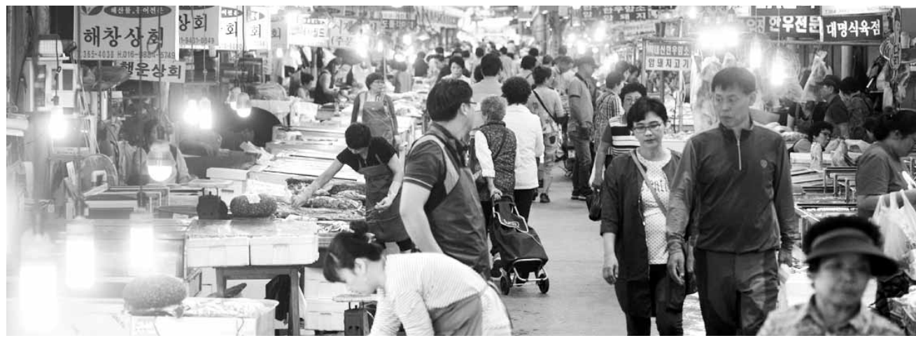
광주 양동시장 상인들이 최근 상인회를 통합하고 적극적인 마케팅을 펴는 등 활성화에 나서고 있다. 사진은 양동시장의 활기찬 모습.