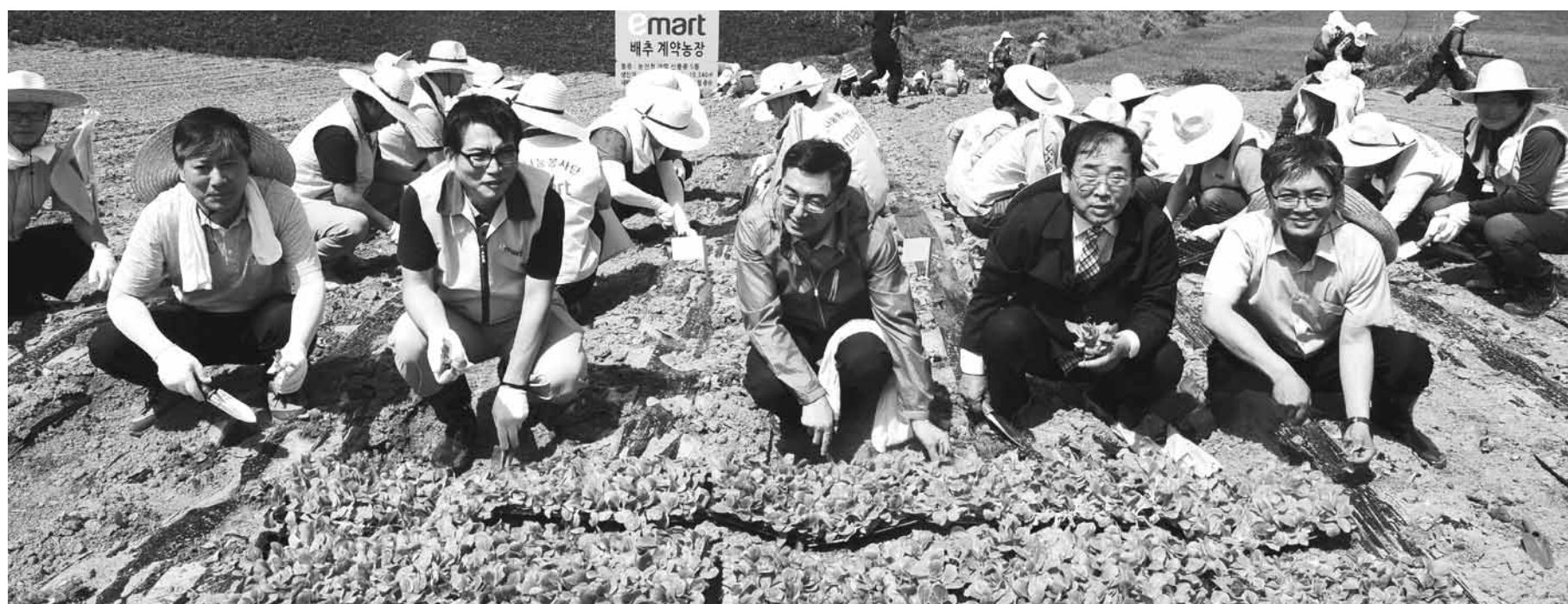
겨울배추 모종 이마트가 신안 갯벌김 등 국산 우수 농수축산물을 대상으로 유통 전 과정에 걸쳐 지원하는 ‘국산의 힘’ 프로젝트가 올해 전남지역 농수산물 매출만 35억원 을 기록하는 등 전국적으로 200억원 돌파를 앞두고 있다. 최근 영광에서 진행된 ‘국산의 힘’ 프로젝트에 참가한 이마트 관계자 등이 겨울배추를 심고 있다.