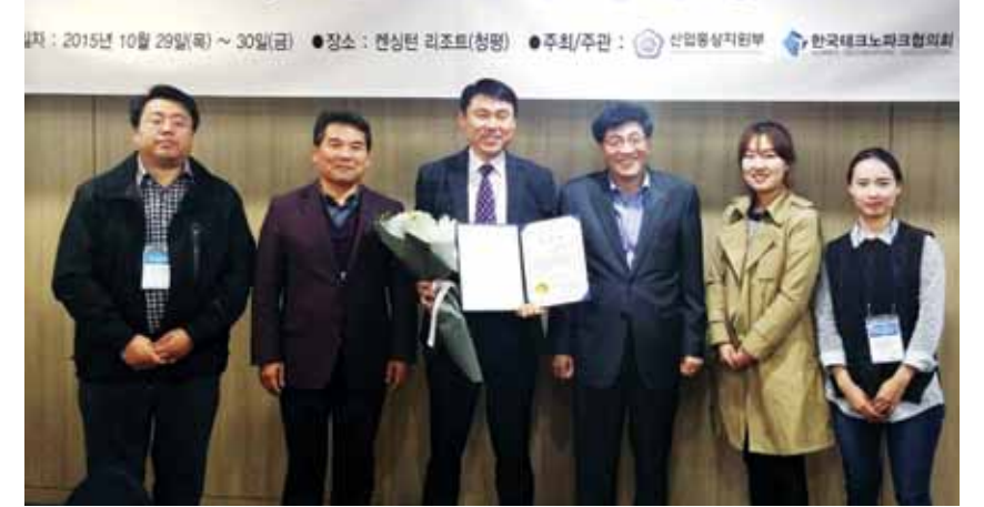
지난달 30일 열린 '2015 전국테크노파크 우수사례 경진대회'에서 광주TP는 산업부 장관상을 수상했다.