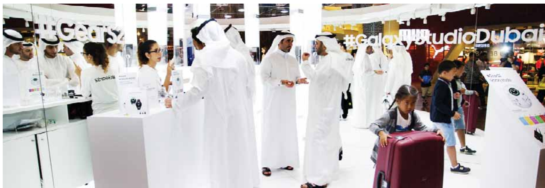
삼성 기어 S2 중동 진출 지난 5일 두바이몰에 마련된 삼성 갤럭시 스튜디오에서 방문객들이 기어 S2를 살펴보고 있다. 삼성전자는 두바이를 시작으로 중동 지역 에 기어 S2를 출시하며 기어 S2 글로벌 공략을 강화한다.