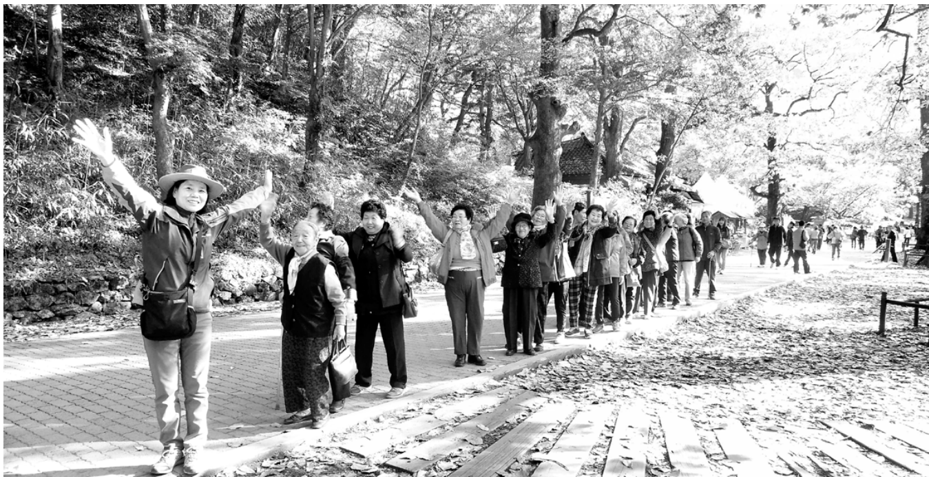
행복한 '단풍 나들이' 장성군이 최근 재할 프로그램으로 마련한 '백양사 단풍 나들이' 행사에서 지체장애인과 치매예방센터 회원들이 숲길을 거닐며 즐거워하고 있다.

화순군은 어린이의 안전한 생활과 사회문화를 조성하기 위해 녹색어머니회 구성, 어린이안전지도제작, 어린이 안전교육, 스타드난안전시스템 구축·운영 등 특화사업을 포함한 25개 우수 시책을 추진한 점이 높은 점수를 얻었다. /화순=조성수기자 css@