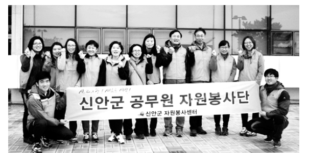
신안군 공무원 자원봉사단

신안군 공무원 자원봉사단은 최근 신안읍해읍에 거주하는 독거 노인 2가구를 방문