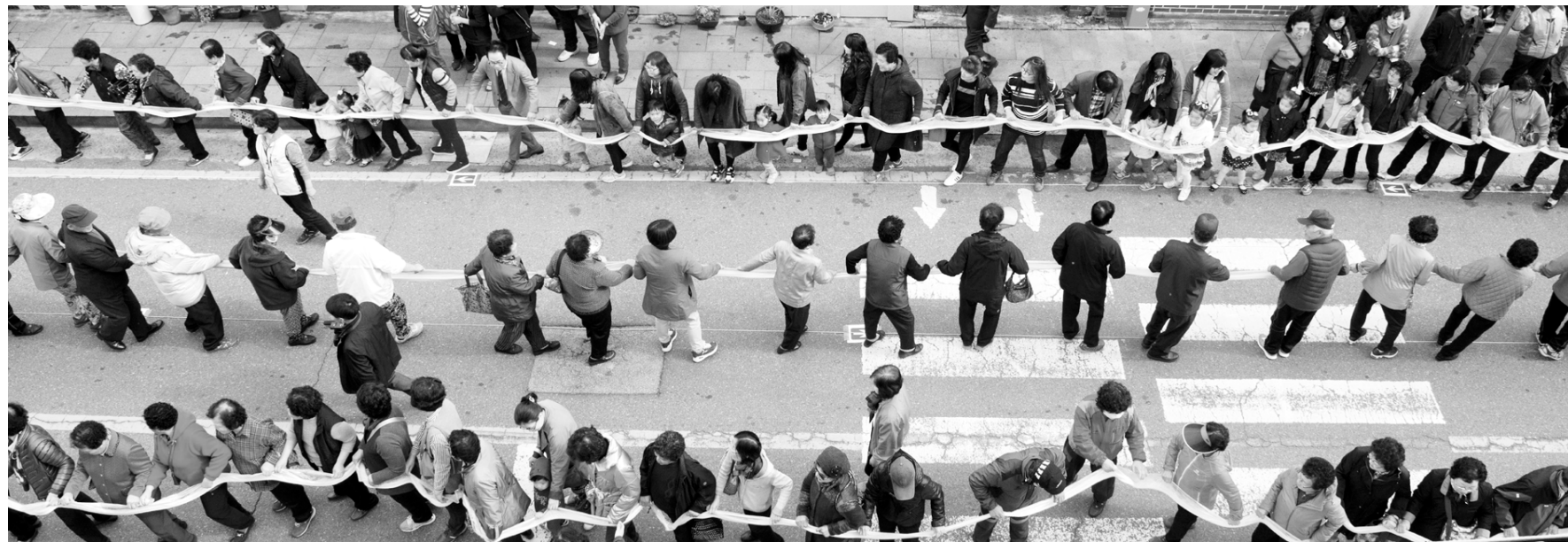
220m짜리 가래떡 11일 광주시 남구 양림동 소담떡방 앞길에서 주민 500명이 길이 220m짜리 가래떡을 만들고 있다. 남구와 양림동주민들이 주최한 이날 행사는 가래떡데이를 기념해 열렸다.