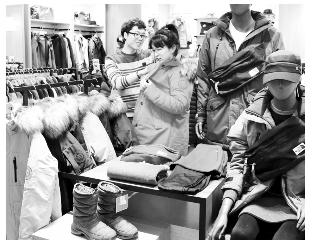
광주신세계는 오는 15일까지 수험생을 위해 옷과 화장품 등을 10~30% 할인해주는 특별 행사를 한다.