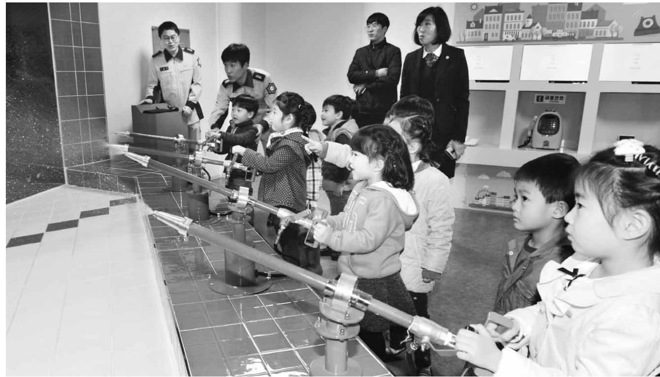
우리는 꼬마소방관 최근 광주시청 1층 시민의 숲에 개관한 '안전체험관'에서 어린이들이 진화 체험을 하고 있다.

어린이들에게 안전습관이 몸에 자연스럽게 밸 수 있도록 체계적으로 교육이 진행되며 체험을 하는데 모두 1시간 가량 소