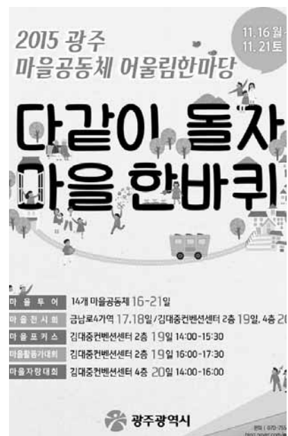
체가 대상, 우수상, 장려상을 놓고 사례를 발표해 참석자들의 투표로 우열을 가린다.