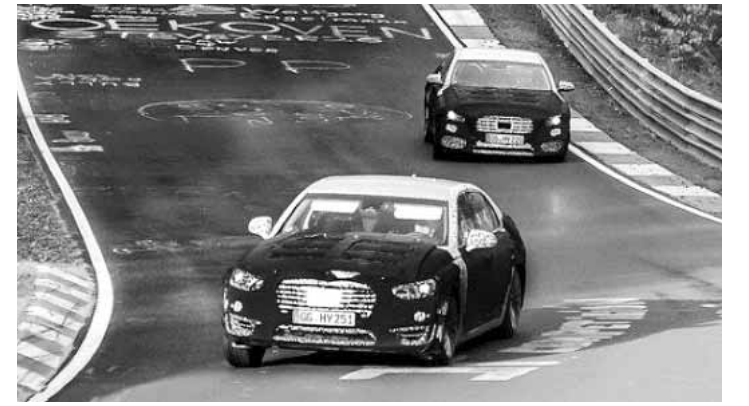
제네시스 최고급 모델 EQ900 시험 차량이 지난 13일(현지시간) 독일 니르부르크링 테스트 트랙을 질주하고 있다. 전 세계 주행시험장 중 가장 험한 코스로 평가받는 곳이다.

중고차 매매업계 한 관계자는 "기존 그랜저·아반떼·소나타 트로이카가 인기를 끌던 중고차시장에 K5가 새로운 강자로 떠올랐다"며 "K5는 세련된 디자인과 중형세단 라인 중 저렴한 가격으로 인기를 끌고 있었고, 이에 K5 신차 출시가 겹치면서 중고차시장에 매물이 유입된 게 영향을 준 것으로 보인다"고 말했다. /김대성기자 bigkim@kwangju.co.kr