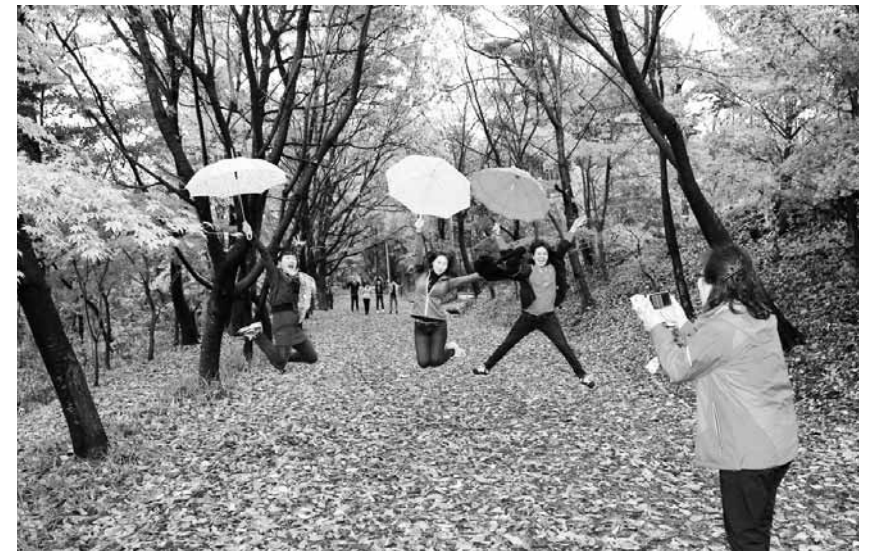
화순 너릿재 옛길의 늦가을 늦가을 보슬비가 내린 지난 16일 화순 너릿재 옛길을 찾은 단체 나들이객들이 가을 단풍을 배경으로 기념촬영을 하고 있다.