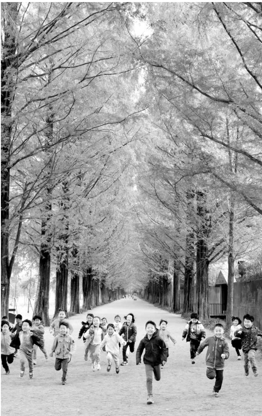
메타세쿼이아길에 활짝 핀 동심 전국에서 가장 아름다운 가로수 길'로 꼽히는 담양 메타세쿼이아길을 찾은 아이들이 17일 늦가을 나무 사이에서 신나게 뛰어 놀고 있다.