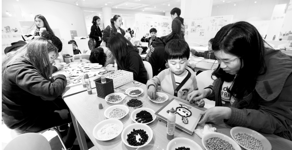
국립아시아문화전당 개관 기념 ‘2015 전국 어린이박물관 박람회’ 행사에서 어린이들이 체험 프로그램에 참여하며 즐거워하고 있다. 이번 박람회는 12월 3일까지 열린다.

국립현대미술관·만화박물관 등 참여 박람회 극단 사다리 유아 공연 ‘베이비 드라마’ 눈길 음악인형극 ‘깔깔 나무’... 교육 콘텐츠도 풍성