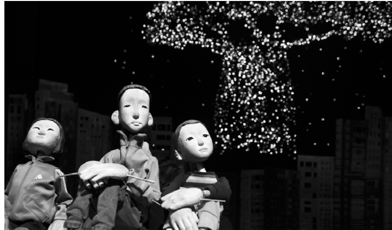
어린이 연극 ‘깔깔나무’