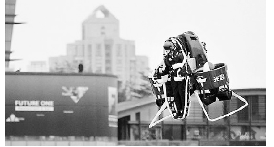
제트팩(jet-pack)의 상업화에 앞서 지난 6일 선전시 환러(歡樂)해안 테마파크에서 이뤄진 첫 시험비행이 성공적으로 이뤄졌다.

한편, 무한상상실에서 진행되는 교육프로그램에 대한 자세한 정보나 장비대여 신청 등은 무한상상실 홈페이지(www.ideaall.net)에서 확인할 수 있다. /박기용기자 pboxer@kwangju.co.kr