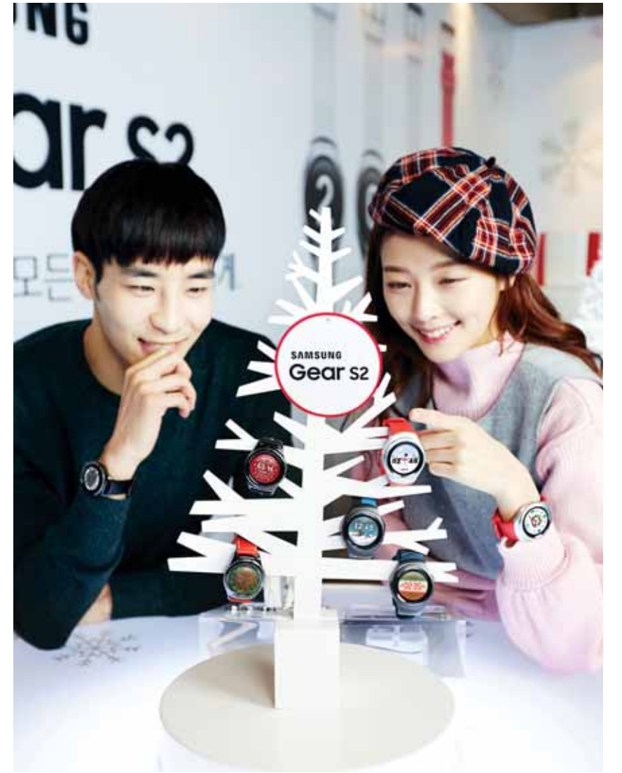
삼성 기어 S2용 크리스마스 워치페이스 15종 출시

삼성전자가 연말을 맞아 기어 S2용 크리스마스 워치페이스 15종을 출시한다고 20일 밝혔다. 기어 S2의 사용자들은 연말 분위기의 눈사람, 산타, 루돌프, 스노우 볼, D-day 카운터 등의 워치페이스를 취향에 맞게 자유자재로 변경 할 수 있으며, 워치페이스는 삼성 기어 앱을 통해 무료로 다운로드를 할 수 있다. <삼성전자 제공>