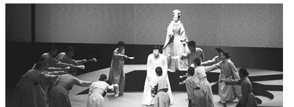
판소리? 창극! 오락가락' 한 장면

청이 울었다', '판소리? 창극! 오락가락'을 공연한다. '심청이 울었다'는 공양미 삼백석에 인당수로 떠나가는 심청의 과거와 미래의 순간을 교차시킨 판소리 춤극이다. '판소리? 창극! 오락가락'은 놀부 박타는 대목과 심봉사 눈 뜨는 대목을 판소리와 창극으로 선보인다. 남원=정규성기자 jgs@kwangju.co.kr