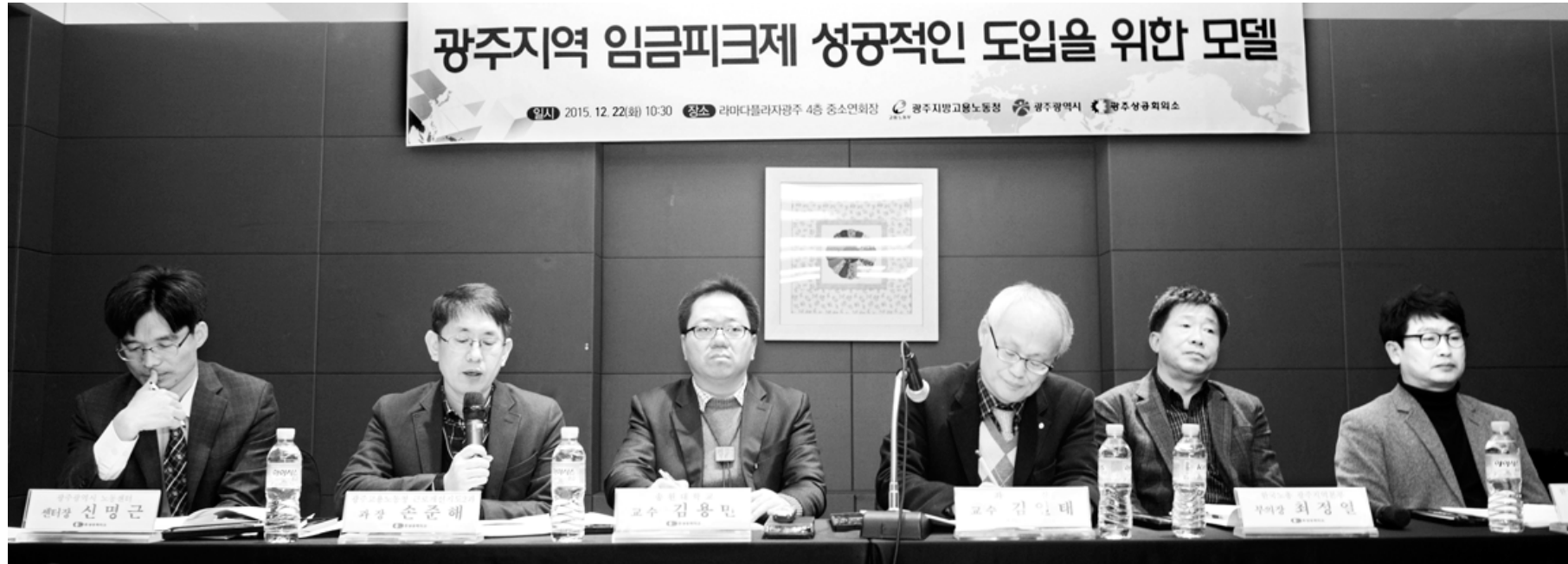
지난 22일 라마다플라자광주호텔에서 토론회 참가 패널들이 '광주지역 임금피크제 성공적인 도입을 위한 모델'에 대해 토론했고 있다.