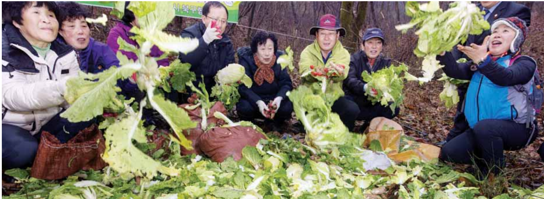
“추운 겨울 잘 견디렴” 광주 북구와 자연보호북구협의회, 야생동식물보호협회 회원들이 23일 광주시 북구 삼각산 일대에서 겨울철 야생동물의 먹이가 될 감자, 고구마, 배춧잎 등을 뿌려주고 있다.