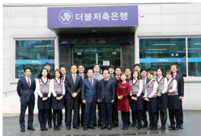
더블저축은행 임직원들이 24일 연말을 맞아 광주 사회복지공동모금회에 200만원의 성금을 기탁했다.