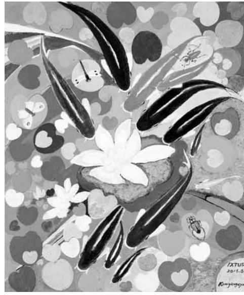
김양균 전 헌법재판관이 그린 작품 'IXYUS'.