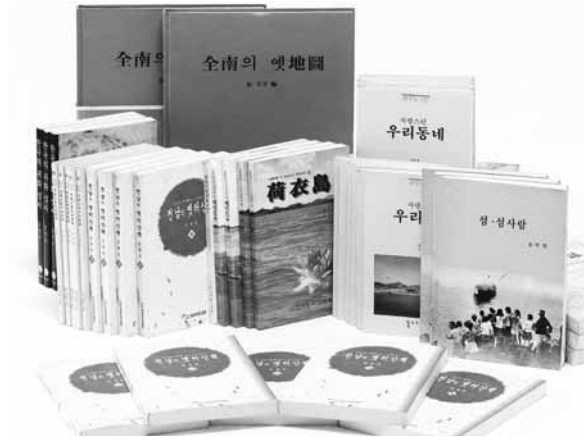
김정호 향토사학자의 저서.