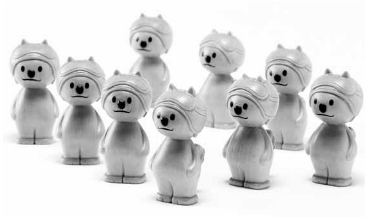
스튜디오푸쉬하이커가 위탁한 공병욱 작가의 '동개비 목각인형'.

60년간 간직한 십자가, 2002년 월드컵 때 사용한 축구공, 수십년간 사용한 문블랑 볼펜... 오랜 세월 만큼이나 각종 사연을 간직한 명사들의 애장품이 경매에 나온다. 광주문화재단이 기금 마련 문화경매를 위해 시민, 정치인, 예술인 등 41명이 위탁한 애장품을 미리 보는 사전전시 '미리보시유'를 오는 2016년 1월 12일까지 빛고을시민문화관 1층 전시장에서 개최한다.