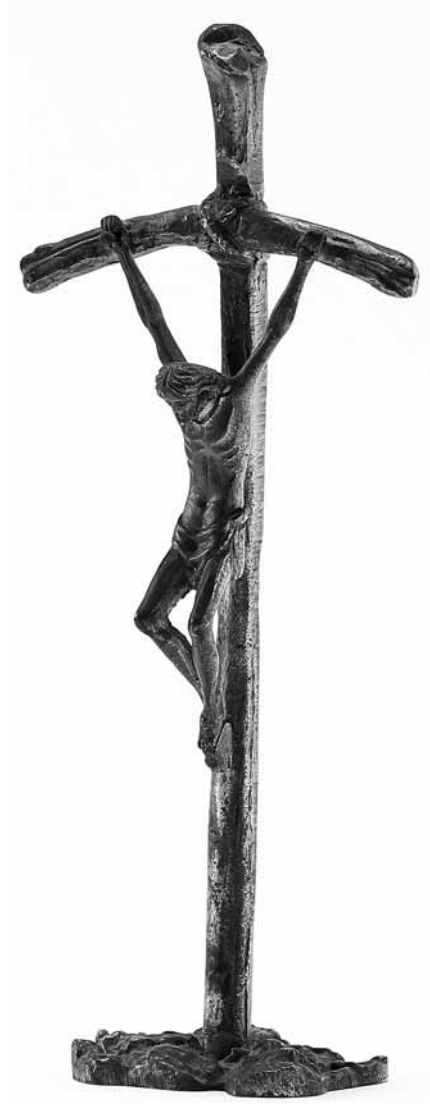
김희중 대주교가 60년간 간직한 십자가.