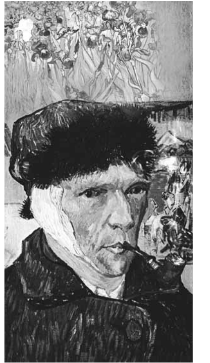
'블랙 신 고흐 자화상'