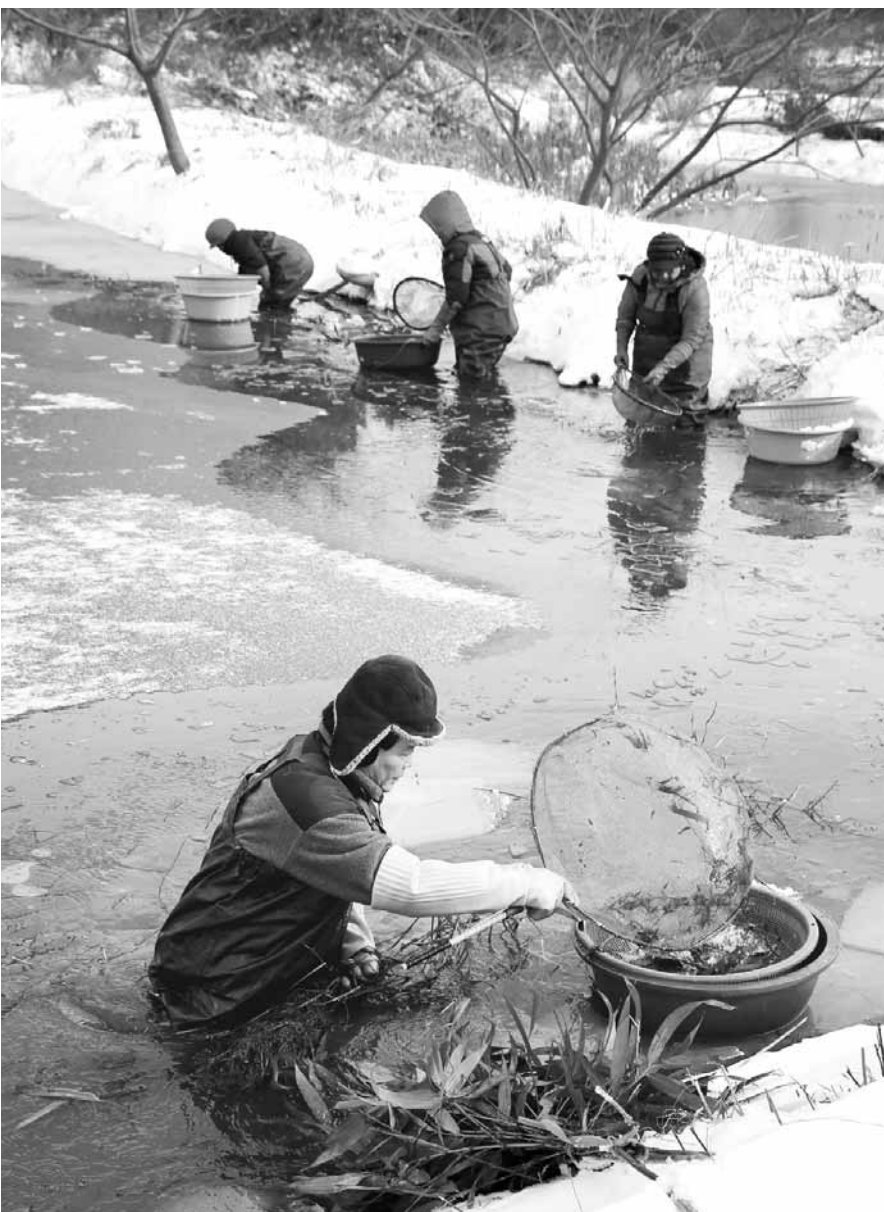
살얼음 깨고...한파 속 토하잡이 매설게 불어 닳던 한파가 연일 기승을 부리고 있는 가운데 강진군 읍천면 주민들이 산골짜기 다랑이 논에서 1급수 청정지역에서만 자라는 민물새우 토하(土蠶)를 잡고 있다. 읍천면은 연간 5톤의 토하를 잡아 일반 벼농사 때보다 5~6배의 수익을 올리고 있다.

이번 군민과의 대화에서는 읍면 실과장들이 함께해 각 지역별 현안사업들에 대한 설명도 곁들인다. /강진=남철희기자 chou@