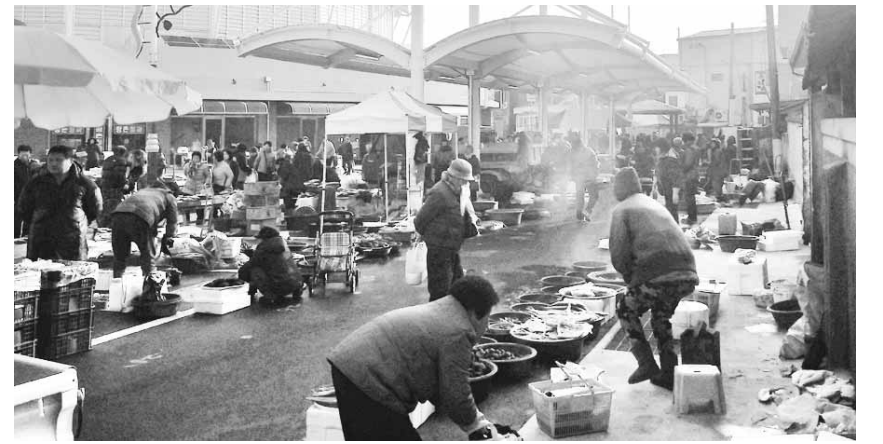
현대화 사업을 통해 새단장한 장흥군 대덕읍 전통시장을 찾는 지역민들의 발길이 줄을 잇고 있다.

장흥군 관계자는 "최근 친환경 식품에 대한 관심이 높아지며 장흥 특산물의 주가가 높아지고 있다"며, "직거래와 온라인 마케팅을 강화해 소비자의 선호에 따른 건강한 농수산물 유통에 노력하겠다"고 밝혔다. /장흥=김용기기자·중부취재본부장