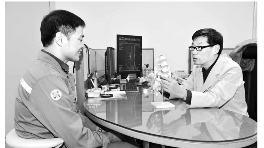
광양제철소의 한 직원이 사내 건강센터에서 건강 상담을 받고 있다.

황숙주 순창군수는 “이번 전통장 복원은 소비자들이 장이라 하면 콩을 원료로만 생각하고 있지만, 사실 선조들은 다양한 원료와 방법을 통해 장을 담아왔다는 것을 알려주기 위해 시작한 것”이라면서 “앞으로 1인 가구 증가와 주거형태 변화, 소비자 취향이 변하는 만큼 다양한 전통장을 개발해 지역 장류산업의 경쟁력을 높여 나가겠다”고 말했다. /순창=서은총기자 sye@